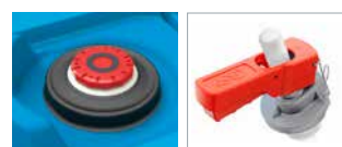
Blaue Varibox und rotes Kopplungssystem