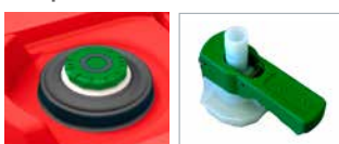
Rote Varibox und grünes Kopplungssystem