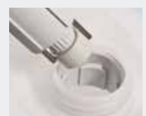
MEIKO Sauglanzensystem Speziell für Doyen-Produkte von etol