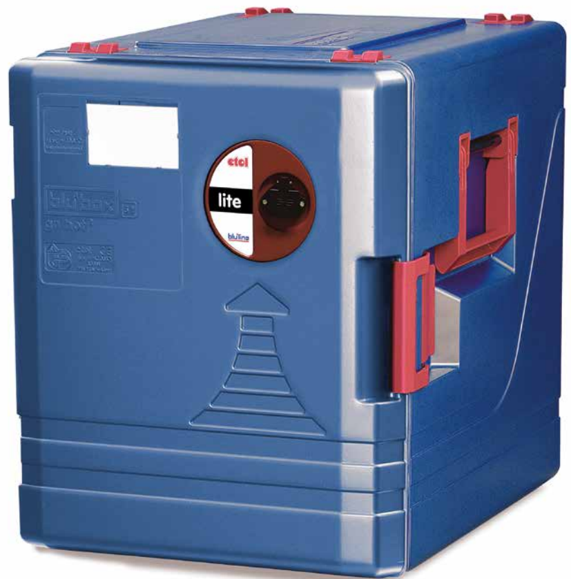
Rozkład temperatury /Pobór moc