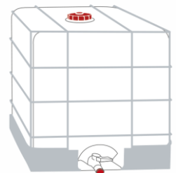
Container 600 kg Art.-Nr.: 2000480