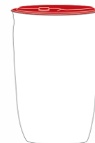
Fass 250 kg Art.-Nr.: 2000273